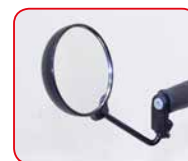
Specchietto Rearview mirror