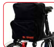
Borsello Shopping bag