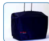
Sacca custodia Carry case

Di Blasi ® Folding vehicles experts since 1974