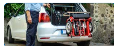
Sollevatore automatico per bagagliaio Automatic hoist for car boot