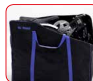
Sacca custodia Carrying bag

Di Blasi ® Folding vehicles experts since 1974